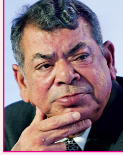
சஷி ரூயா எஸ்ஸார் குழுமம் ரூ. 1,00,100 கோடி