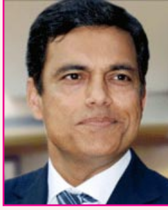
சஜ்ஜன் ஜிண்டால் ஜேஎஸ்டிபிஎய் குழுமம் ரூ. 58,171 கோடி