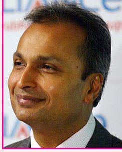
அனில் அம்பானி நிலையன்ஸ் குழுமம் ரூ. 1,25,000 கோடி