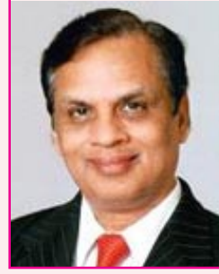
வேணுகோபால் தூத் வீடியோகான் குழுமம் ரூ. 45,405 கோடி