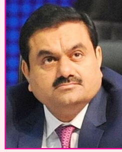
கௌதம் அனூனி அனூனி குழுமம் ரூ. 96,031 கோடி