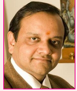
மனோக் கவர் ஜேபி குழுமம் ரூ. 75,163 கோடி