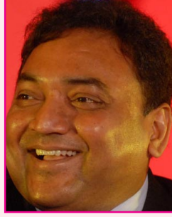
மதுசூதன் ராவ் லான்கோ குழுமம் ரூ. 47,102 கோடி