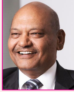
அனில் அகர்வால் வேதாந்தா குழுமம் ரூ. 1,00,300 கோடி